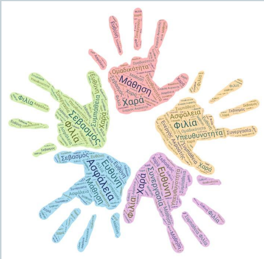
Συννεφόλεξα μέσω iPad